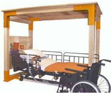
介護ベッド用シェルター