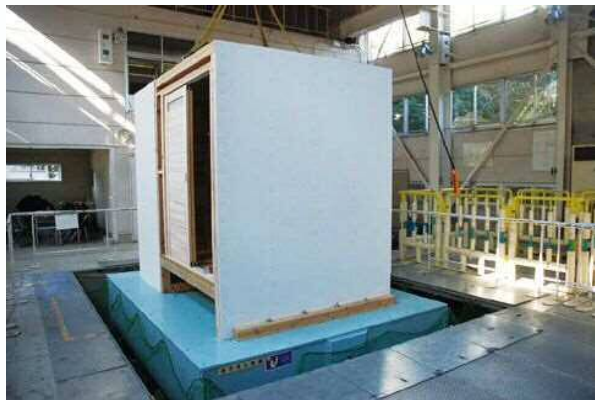
振動実験における装置全景