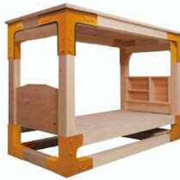
シングルサイズ用